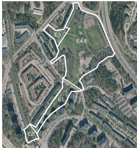
Etappindelning för genomförande av Farstaängen

Som en del av programmet ska tillgängligheten till parken förbättras. Den aktuella trappan ska kompletteras med en barnvagnsramp enligt programmet. En barnvagnsramp är tyvärr inte till hjälp för rullstolar och rullatorer. En ramp för rullstolar får ha en maximal lutning på 1:12. Stockholms stad rekommenderar en lutning på 1:20. Den ramp som planeras att anläggas i det aktuella programmet kommer att ha en lutning på 1:2 till 1:3, vilket således blir för brant. Det finns heller inte utrymme nog för att göra en serpentinväg med godkända lutningsförhållande då platsen kantas av två privata fastigheter.